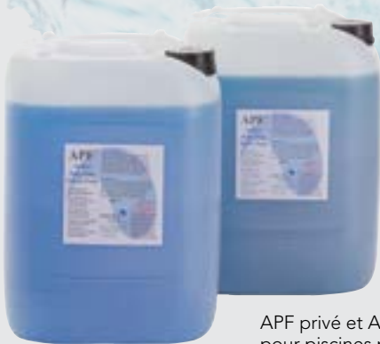
APF privé et APF public: pour piscines privées et piscines publiques